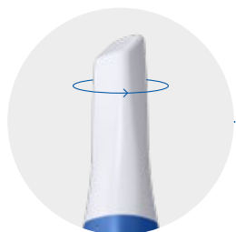
Puntale reversibile a 180°